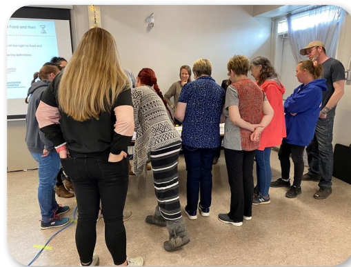
Consultation en Gaspésie-Îles-de-la-Madeleine 25 avril 2023