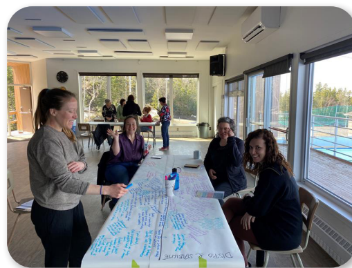
Consultation au Bas-Saint-Laurent 19 avril 2023