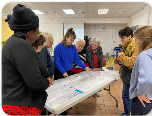
Consultation à Montréal 1 er mars 2023