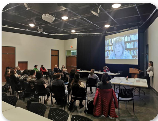
Consultation au Saguenay-Lac-Saint-Jean 29 mars 2023

Dans les prochaines semaines et les prochains mois, nous irons à la rencontre d'acteurs d'autres milieux (institutionnel, agricole, commercial, éducation, environnemental, de la santé, etc.) pour entamer une mobilisation plus large autour du droit à l'alimentation. Nous aimerions aussi connaître les enjeux et les préoccupations propres à chacun de ces milieux afin d'en tenir compte dans nos revendications communes. Nous poursuivrons par la suite nos réflexions autour de l'élaboration du projet de loi-cadre sur le droit à l'alimentation, alimentées par ce que nous aurons entendu et procéderons à sa rédaction. Ce sont donc des étapes charnières qui s'amorcent, et nous sommes fières de vous compter parmi nos alliés des premières heures.