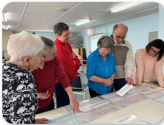
Consultation sur la Côte-Nord 28 mars 2023

Englobe les discussions entourant les effets de différentes activités humaines sur les écosystèmes et les habitats des animaux. Différentes anecdotes ont été racontées pendant les consultations montrant les inquiétudes des gens quant aux impacts des activités humaines sur les ressources disponibles (p. ex., exploitation des ressources, expansion des villes, destruction des écosystèmes).