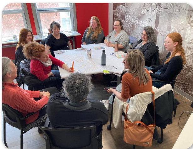
Consultation en Montérégie 21 mars 2023

Recense les discussions tenues entourant les montants et les destinataires du financement qu'on accorde et le fait que certains types d'initiatives reçoivent un financement insuffisant. L'enjeu général du financement est revenu tellement souvent dans les discussions qu'il valait la peine d'en faire un thème en soi.